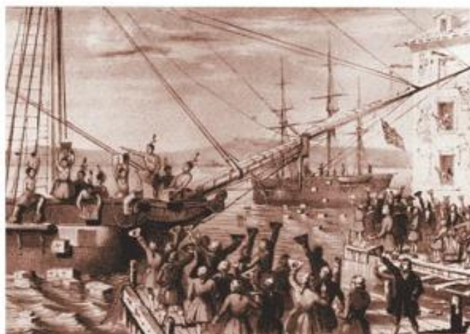
Litografía sobre el motín del té de 1773.

Colono: identifica a una persona que salió de su lugar de origen para establecerse en otro distante. Sin embargo, etimológicamente, colono significa persona que cultiva la tierra.