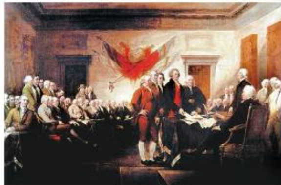
Declaración de la Independencia de los Estados Unidos.