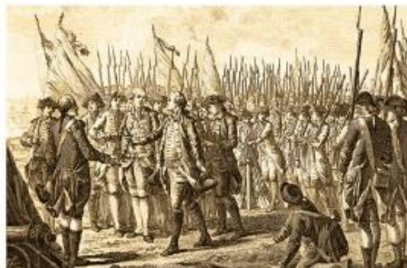
El general inglés Cornwallis firma la Capitulación de Yorktown.